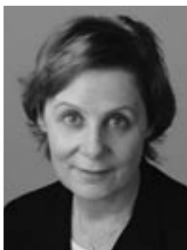
Martine Brunschwig Graf

Qui aurait cru, il y a 6 ans à peine, qu'il soit possible d'introduire dans la Constitution fédérale des dispositions concernant la scolarité? Pas grand monde en vérité.