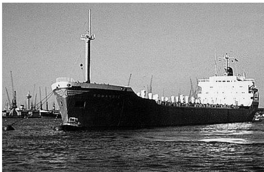
Romandie, un grand navire