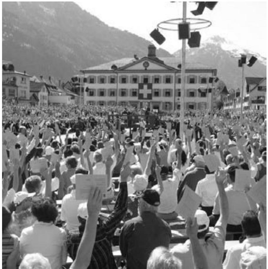
Landsgemeinde Glaris.

C'est pourquoi je pense que le 21 mai offre à toutes et à tous l'occasion de porter ensemble un beau projet, porteur d'avenir et d'espoir.