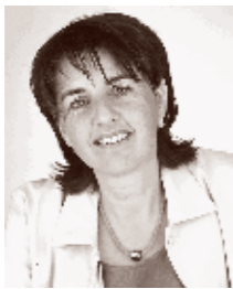
Elisabeth Baume-Schneider (JU) préside la CIIP depuis mai 2009.