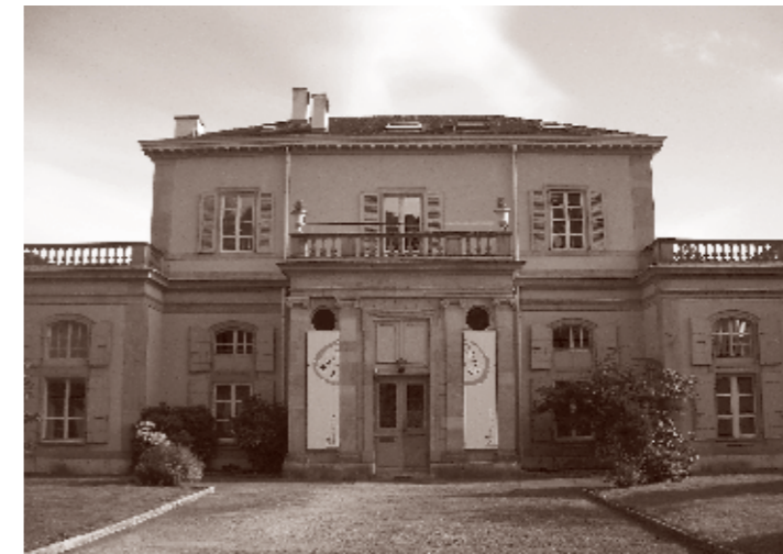
Siège de la CIIP, Neuchâtel